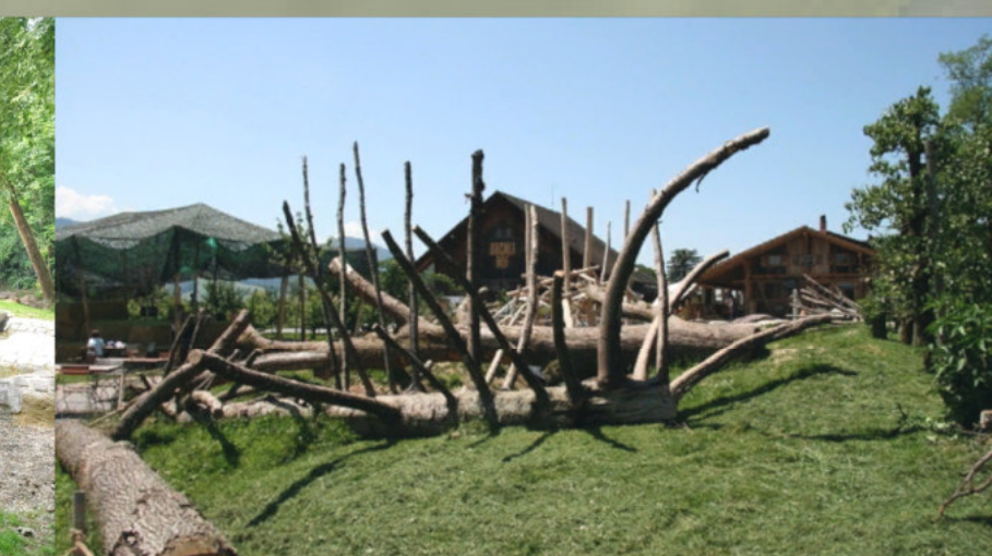
Kletterbaum - Symbolbild